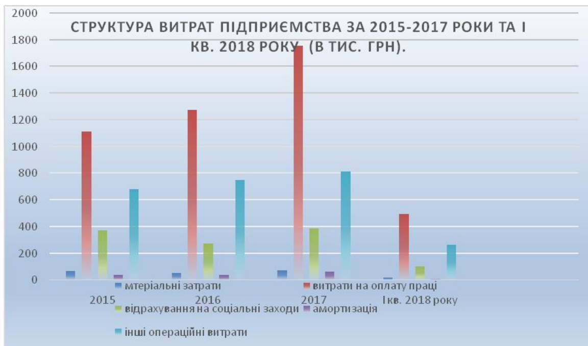
Рис. 3. Структура витрат Підприємства за 2015-2017 роки та I кв. 2018 року (в тис. грн).

Відповідно до даних фінансової звітності (зокрема, Звітів про фінансові результати (Звіт про сукупний дохід) форми № 2), операційні витрати за 2015 рік склали 2 280,00 тис. грн, за 2016 рік 2 391,00 тис. грн (більше проти 2015 року на 111,00 тис. грн або на 4,87 %), за 2017 рік – 3 096,00 тис. грн (більше проти 2016 року на 705,00 тис. грн або на 29,5 %), за I квартал 2018 року – 893,00 тис. гривень.